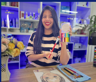
Brillithe Pico Face Painter